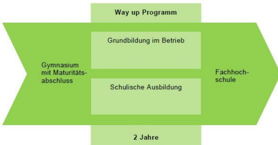
Abbildung 3: Way up Programm (in Anlehnung an Kanton Zug, 2019)

In einer verkürzten Berufslehre holen sich die jungen Erwachsenen in zwei statt drei bzw. in drei statt vier Jahren das eidgenössische Fähigkeitszeugnis EFZ und sichern sich damit den Einstieg in die Arbeitswelt und zusammen mit der (gymnasialen) Matura den direkten Zugang an eine Fachhochschule (vgl. Abb. 3). Das ursprünglich vom Branchenverband SWISSMEM ins Leben gerufene Programm- «way-up» ist gegenwärtig für folgende Berufe verfügbar: Automatiker/in, Elektroniker/in, Informatiker/in, Konstrukteur/in, Polymechaniker/in und Mediamatiker/in und Kaufmann/Kauffrau. In Zug und Bern kann zusätzlich die Lehre Zeichner/in verkürzt absolviert werden.